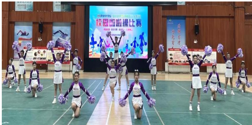
图 9 职校社团啦啦操表演

学生每日下午课后参与活动。社团活动为学生提供更多实践与展示的平台，有效提升学生美育实践能力、艺术素养和美好情操。