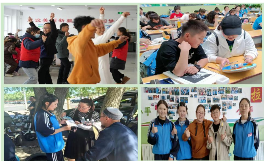
图 3 北屯职校“三进两联一交友”活动掠影

“三进两联一交友”活动引导师生在生活、工作、学习中相互了解、相互包容、相互学习、相互帮助，发挥了家校共育合力，进一步促进各民族师生之间交往交流交融。