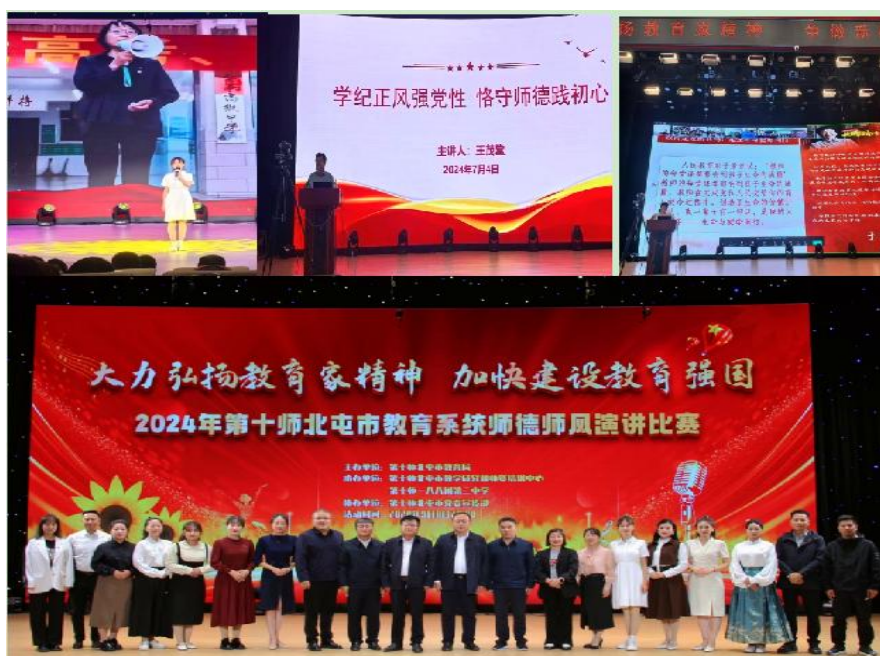
图 2 “弘扬践行教育家精神 争做新时代大先生”系列活动

师市教育局制定《第十师北屯市教育系统“弘扬践行教育家精神 争做新时代大先生”系列活动实施方案》《第十师北屯市教育系统关于开展“守初心立师德铸兵魂”师德师风提质活动的实施方案》，教育引导广大教师以弘扬和践行教育家精神为目标，通过开展系列活动促进教师学思践悟，增进对教育家精神思想内涵的理解，增强在教育教学中践行教育家的自觉性和主动性，将弘扬教育家精神的任务要求与教师队伍建设改革实践紧密结合。通过依法执教和师德师风建设专题网络培训、教育家精神宣讲、师德师风演讲比赛、“领雁工程、青蓝工程、雏鹰工程”教师培优工程、优秀教师感动瞬间微视频宣传展播、师德标兵典型示范等六项活动，让教师真切感受践行教育家精神的成就感和幸福感，激励教师努力成为新时代“大先生”做好培根铸魂的教育事业，职校教师积极参与活动，以实际行动传承和推动教育家精神、工匠精神在师市职业学校落地生根。