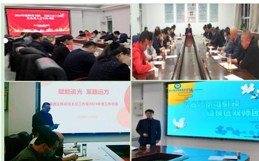
图 1 名班主任工作室及各类人才年终考核现场

最后，教育局局长总结讲话，充分肯定各工作室和各类人才一年来的成果，希望把各名师工作室作为培养十师优秀教师重要的发源地、集聚地和未来名师孵化地，并提出名师要有名、有位、有为，带动学科建设，形成一批优质研修成果，广泛传播先进理念和方法，带动更多教师共同进步，在学科建设中真正起到示范、引领作用。