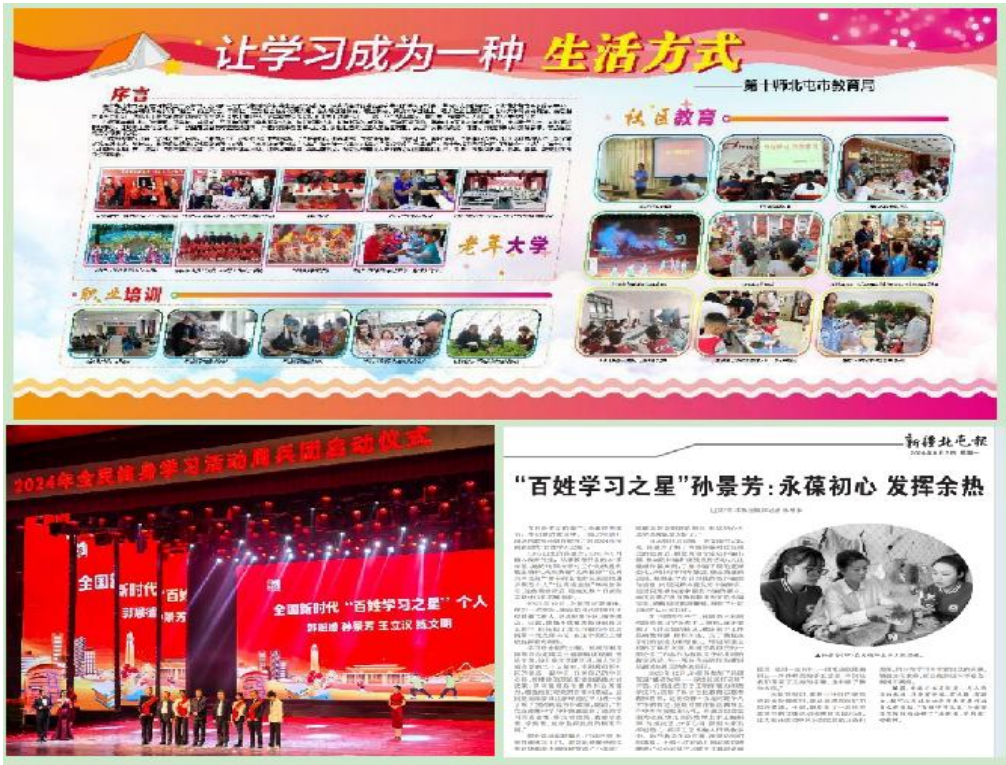
图 10 全民终身学习活动周加强宣传引导