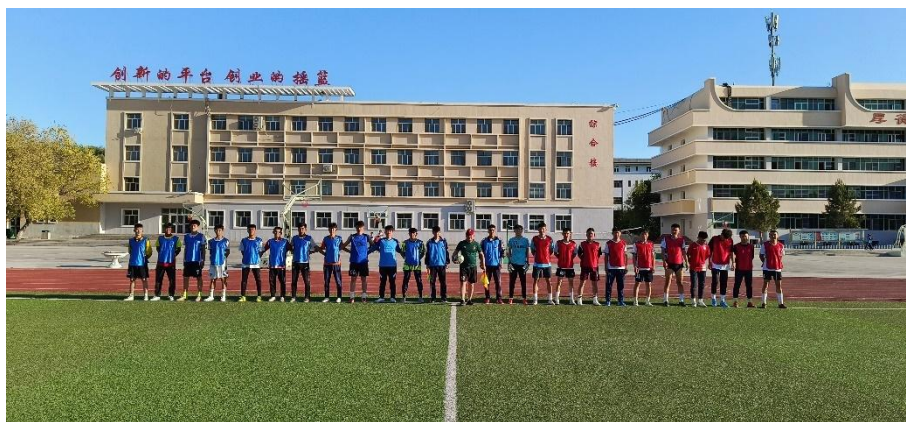
图7 北屯职校学生与第十师北屯市足球协会友谊赛合影

体育教育。北屯职校现有体育课专任教师4人，组织全体学生参加国家学生体质健康标准测试，合格率达97.22%。职校持续组织开展“铸牢中华民族共同体意识”主题校园篮球、足球赛、校园运动会等系列活动。2024年春季，职校学子代表师市参加兵团第十一届速度滑冰锦标赛，取得男子甲组3000米第二名、追逐赛第二名、全能第四名等优异成绩，助力师市获得比赛团体总分第一名；首次组队参加全国青少年校园足球比赛兵团赛区高职院校比赛，参赛队员顽强拼搏、敢于争先，获该组亚军，好评如潮。