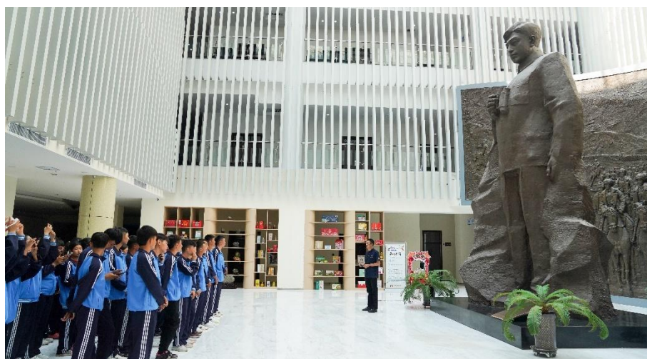
图 11 北屯职校新生参观北屯博物馆，了解兵团历史

通过观红色教育基地、讲红色故事、绘红色书画、看红色电影、答红色知识、唱红色歌曲，“六红教育”系列活动。学生直观感受革命先烈英勇事迹和革命历史的艰辛历程。职校邀请革命后代、英雄模范进校园，通过讲座、座谈会等形式，讲述革命故事，传承红色精神，厚植爱国情怀。