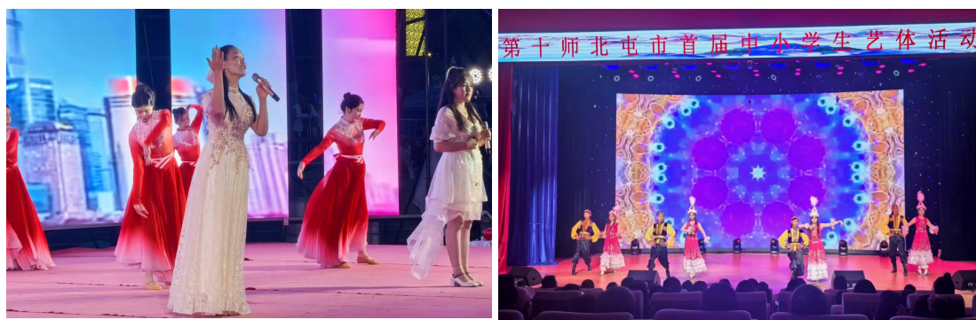
图 8 北屯职校师生参加文艺展演获好评

职校以校级活动为基础，组织师生积极参与师级展演活动，在职业教育活动周、校园文化艺术节文艺晚会、第十一届职工文艺汇演暨“北屯之韵”广场文化活动、十师“丝路风情·诗意北屯”中秋晚会、“放歌中国”走进第十师北屯市文艺演出等，中职学生以舞蹈、歌曲、乐器演奏等多种形式展示自信与才华，提升职校美誉度和影响力。