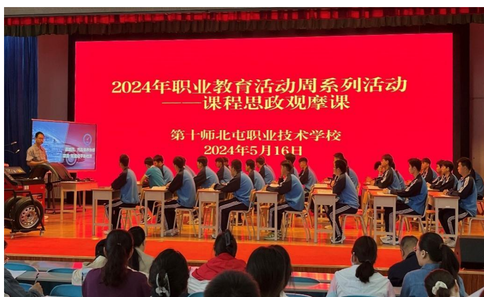
图 4 北屯职业技术学校思政观摩课现场

三是融入各项活动。师市党委领导班子围绕兵团成立 70 周年主题，深入挂钩学校讲授思政课、开展工作调研。指导职校制定《第十师北屯职业技术学校课程思政建设实施方案》系统化、规范化、体系化加强课程体系建设，通过行之有效的活动，讲好中华民族的故事、中国共产党的故事、中华人民共和国的故事、中国特色社会主义的故事、改革开放故事、各领域创新发展的故事等，将课堂理论学习延伸到课外社团、志愿活动、社区服务等多种平台，开展学生乐于参与实践的“活动课”内化渗透，让思政教育生动有趣，增强实效性，引导学生自觉践行社会主义核心价值观。