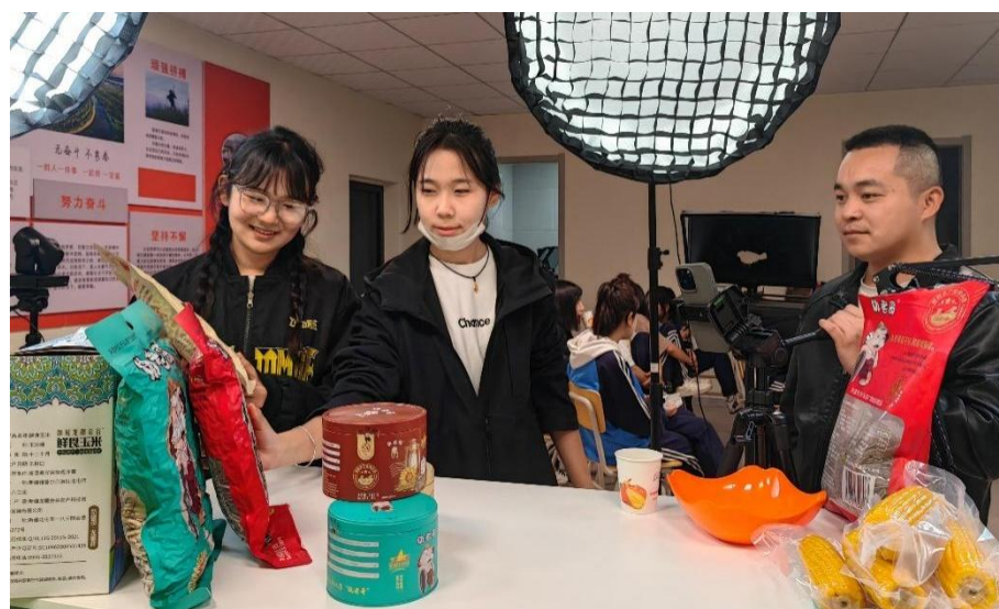
图 6 北屯职校学生在电商实训室实操

2023~2024 学年，投入 160 万元建成智慧校园管理平台，投入 88.6 万元建设旅游服务与管理、工艺美术、电子商务 3 个品牌专业数字教学资源库，投入 52.1 万元开发 4 门在线精品课程，投入 30 万元开发 3 门活页式教材，投入 100 万元用于校园可视化安防系统及配套设施设备，投入 84 万元建设直播电商实训室及录播室。